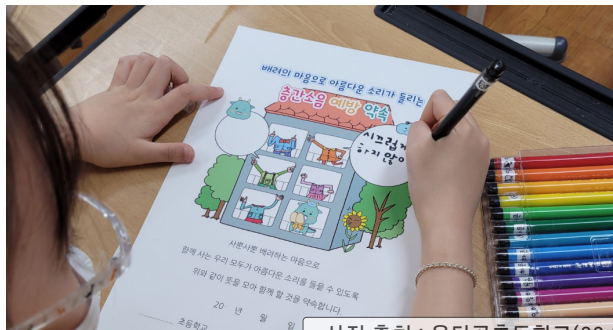
사진 출처 : 웃터골초등학교(23.05.03)