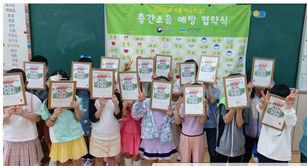
사진 출처 : 노일초등학교(23.05.12)